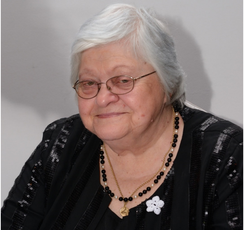
In memoriam Zoe Petre (23.08.1940-01.09.2017)